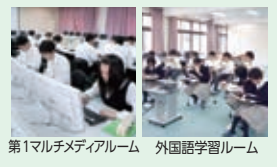
第1マルチメディアルーム 外国語学習ルーム

3年間学ぶ校舎と施設を、じっくり見学できます。教員がガイドになってご案内します。