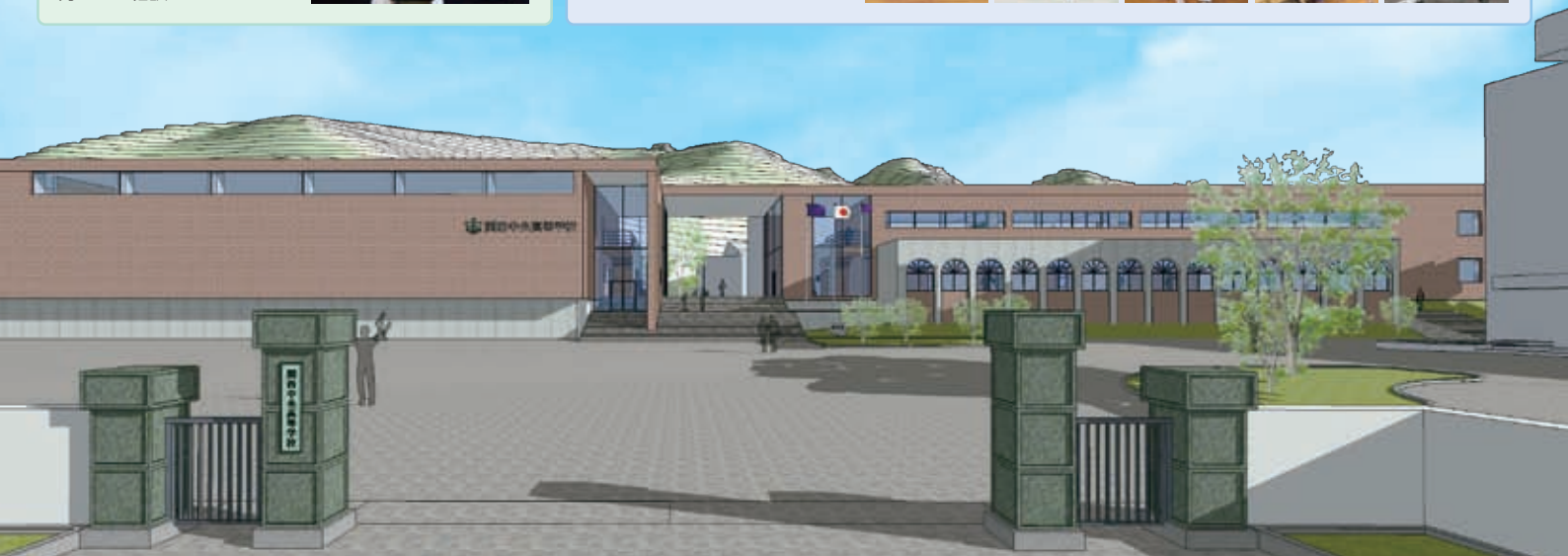
平成24年度新校舎完成予定

上記日程に参加できない方は、個別に対応させていただきます。お問い合わせは企画広報部まで。